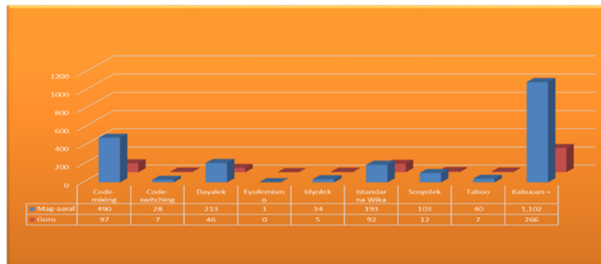
Figur 2. Varayti ng Wika na Ginamit sa Twitter

Samantalang sa mga guro naman ay mayroon itong pito (7) na varayti ng wika: nangunguna rito ang code-mixing na mayroong 97; pangalawa ang istandard na wika na mayroong 92; pangatlo ang dayalek na binubuo ng 46; pang-apat ay sosyolek na mayroong 12; panlima at pang-anim ay taboo at code-switching na mayroong 7; at ang pampito ay idyolek na mayroong 5.