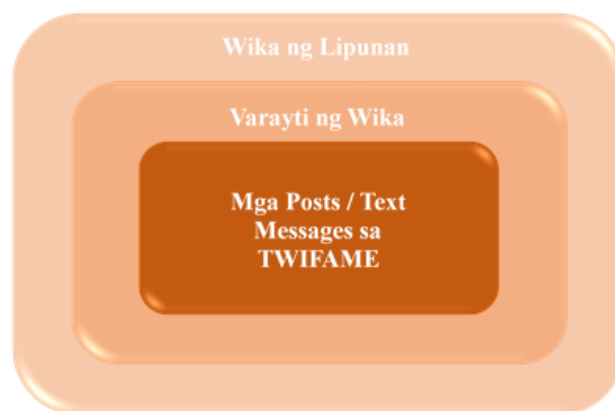
Figyur 1. Iskima ng Paradaym ng Pag-aaral

Sa paglaganap ng social medya bunga ng pagsibol ng pag-unlad ng teknolohiyang pangkabatiran ay umusbong ang isang bagong uri ng wika. Ang wikang ito ay puno ng pagbabago na normal na nagaganap sa lahat ng wika dahil sa pagiging dinamiko nito o buhay. Sa pagiging dinamiko ng wika, nagkaroon ng varayti ang wikang ginagamit sa mga text messages na makikita sa TWIFAME.